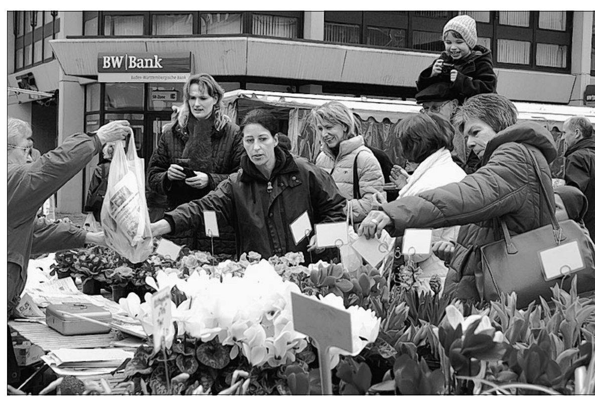
Der Heidenheimer Wochenmarkt: Heute in einer Woche steht er im Mittelpunkt einer gemeinsamen Aktion von SWR 4 und unserer Zeitung.